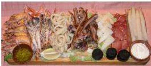
Tabla Mixta de Carne, Pescado y Marisco:

Espárragos, lomo ibérico, queso curado de oveja, chuletillas de lechazo, cigalas a la plancha, langostinos a la plancha, bacalao fresco relleno, calamares a la romana, morcilla de Aranda