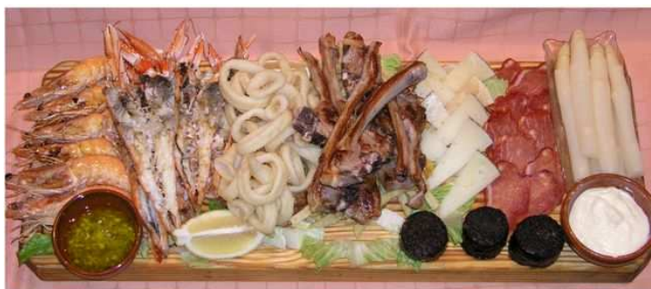
Tabla Mixta de Carne, Pescado y Marisco

Con Espárragos, Lomo Ibérico, Queso, Chuletillas de Lechazo, Cigalas a la Plancha, Langostinos a la Plancha, Bacalao Fresco rebozado, Calamares a la Romana y Morcilla de Aranda.